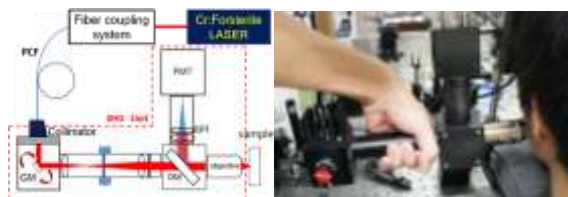
Fig.1 (a) Experimental setup and (b) Experimental

なお、ヒト皮膚 in situ 計測の実験に先立ち、徳島大学大学院ソシオテクノサイエンス研究部研究倫理委員会の承認(#14003)を得た.